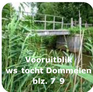
Vooruitblik ws-tocht Dommelen blz. 7-9