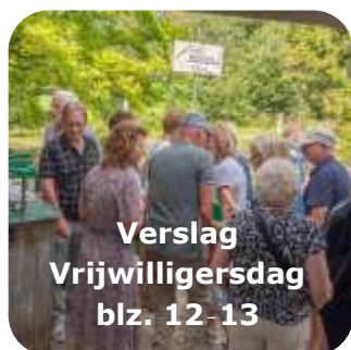
Verslag Vrijwilligersdag blz. 12-13