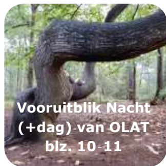
Vooruitblik Nacht (+dag) van OLAT blz. 10-11