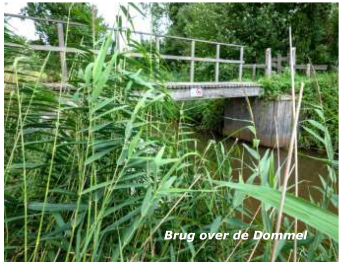
Brug over de Dommel

Na deze fraaie lus komen de 30 en 40 km weer samen om op weg te gaan naar de Grote Heide. Dit gebied is behouden gebleven door de Tweede Wereldoorlog. In het begin van de 20e eeuw vonden in de regio namelijk grootschalige ontginningen plaats, waarbij vennen werden drooggelegd en naaldbossen werden aangeplant. Zo werd in de jaren '30 het Leenderbos aangelegd. Hierbij werd een groot deel van het heidegebied met naaldhout beplant. Toen in 1940 de Tweede Wereldoorlog uitbrak, werden deze werkzaamheden echter gestaakt. Hierdoor lopen we nu in een Kempisch landschap zoals dit er eeuwen geleden ook al uitzag en dat is genieten. We passeren heidegebieden, vennen en stuifduinen en lopen over een afwisseling van kronkelpadjes en brede zandpaden, maar ook langs akkertjes en her en der langs oude boerderijtjes.