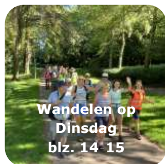
Wandelen op Dinsdag blz. 14-15